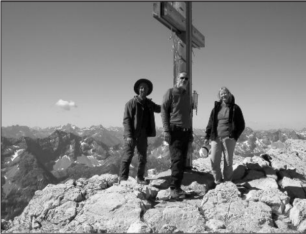
Aud dem Gipfel des Hochvogel

Kondition und Trittsicherheit im Geröll dar. Manch Teilnehmer meinte hier sogar schon vor Überschreitung der Scharte und Sicht auf die Hütte, das Bier riechen zu können.