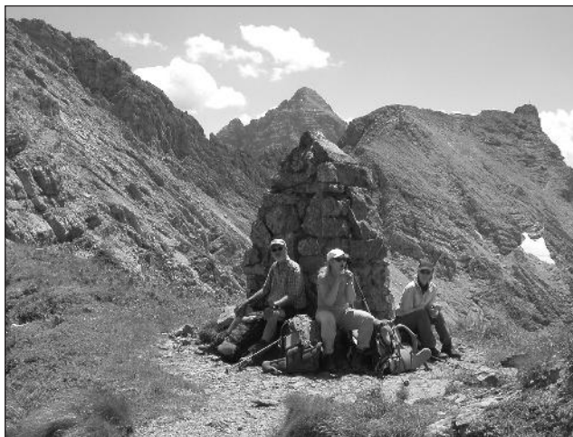
Rast an der Bockkarscharte, im Hintergrund der Hochvogel

eine Pause fällig war. Wir folgten dem Jubiläumsweg, mal rechts, mal links des Bergkammes, bis zum Schrecksee. Hier bogen wir nach Osten zur Landsberger