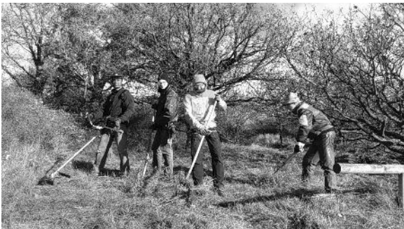
Links: Mäharbeiten am Trockenrasen auf dem Rotenfelsplateau

Angenehmer Nebeneffekt für die Sektion: Die Maßnahmen werden über das „Büro für Landschaftsökologie und Zoologie Twelbeck“ und die Naturschutzbehörde der SGD Nord bezuschusst.