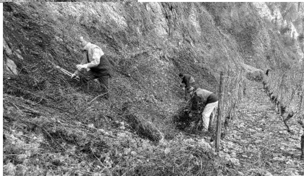
Rechts: Zurückdrängen der Waldrebe am Wandfuß